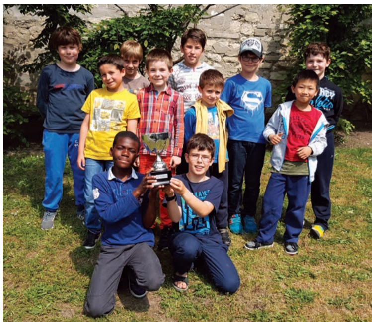
Le tournoi inter-écoles d'échecs 2016, organisé dans le cadre des activités périscolaires, a été remporté par l'équipe de l'école Maurice-Velter.

Sur le temps de la pause méridienne, la Ville propose des ateliers ludiques et pédagogiques en direction des enfants des écoles maternelles et élémentaires. En élémentaire, outre les ateliers d'informatique, de jeux de société et de jeux extérieurs qui sont régulièrement proposés, des ateliers ponctuels sont organisés en fonction des goûts des enfants et des compétences spécifiques des animateurs : atelier roller à Toussaint et Guesde, atelier « Un incroyable talent », concours de dessins sur les animaux marins et réalisation d'une