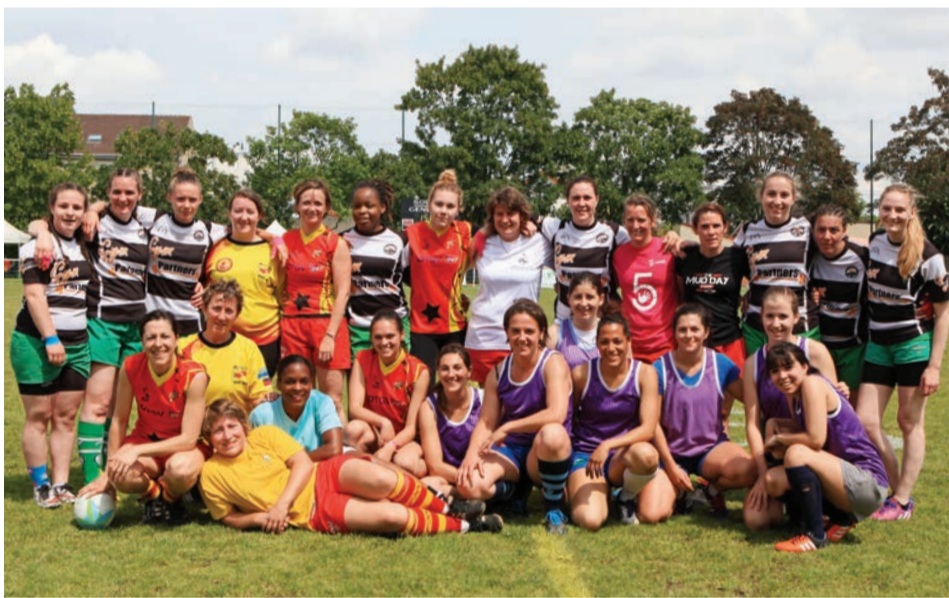
Les joueuses de la section de rugby à cinq (tenue en rouge et jaune) du ROCHC.