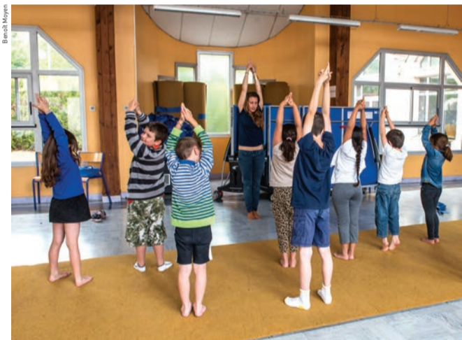
Atelier de découverte de gymnastique douce.

solution de dernière minute. Les tarifs qui seront appliqués en cas de non-réservation des accueils sont les suivants : accueil du matin : 4,50€ ; accueil maternel du soir : 5,20€ ; accueil élémentaire du soir : 4,50€ ; TAP récréatif : 2,10€ ; études surveillées : 5,10€ ; centre de loisirs du mercredi et des vacances : 20€/jour ; restauration : 10€ ; garderie du mercredi : 4,50€.