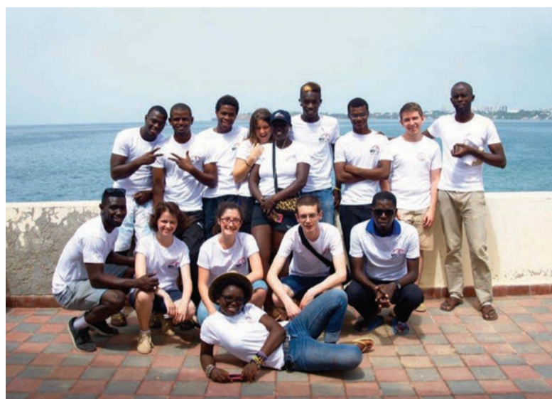
Six jeunes Ovillois ont participé en août à un chantier solidaire au Sénégal.

D u 1 er au 30 août, six jeunes Ovillois, de 18 à 27 ans, ont participé à un voyage solidaire au Sénégal dans le cadre des actions de coopération internationale du conseil départemental des Yvelines. Direction l'île de Gorée, haut lieu de mémoire de la traite négrière, inscrite au patrimoine mondial de l'Unesco en 1978.