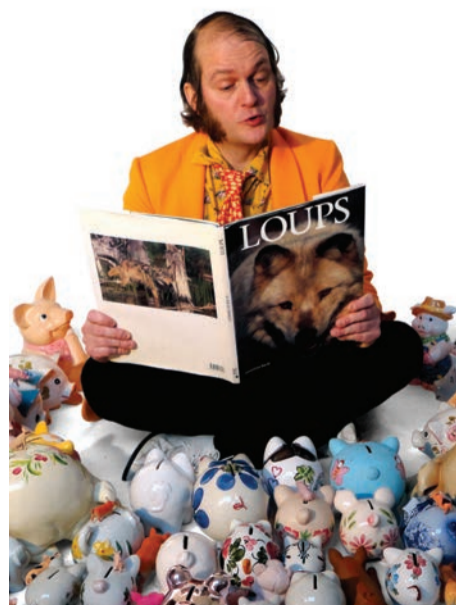
« Les Trois Petits Cochons », par le Théâtre Magnetic.

Réservation : 01 39 15 92 10 / lagraineterie.ville-houilles.fr ■