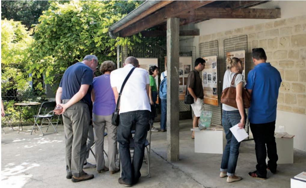
Une exposition sur la citoyenneté est proposée dans les jardins de la maison Victor-Schœlcher.