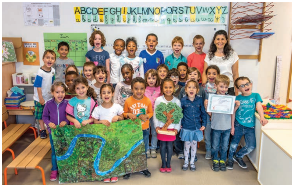
L'école Salvador-Allende a remporté le prix de la création originale dans le cadre du concours organisé par l'association Yvelines environnement.

> Les écoles élémentaires Toussaint, Guesde, Buisson, Bréjeat et l'école maternelle Julliard ainsi que leurs accueils de loisirs ont participé au Grand Prix des jeunes dessinateurs de la fédération des Parents d'élèves de l'enseignement public (PEEP) sur le thème « Dessine la fête foraine de