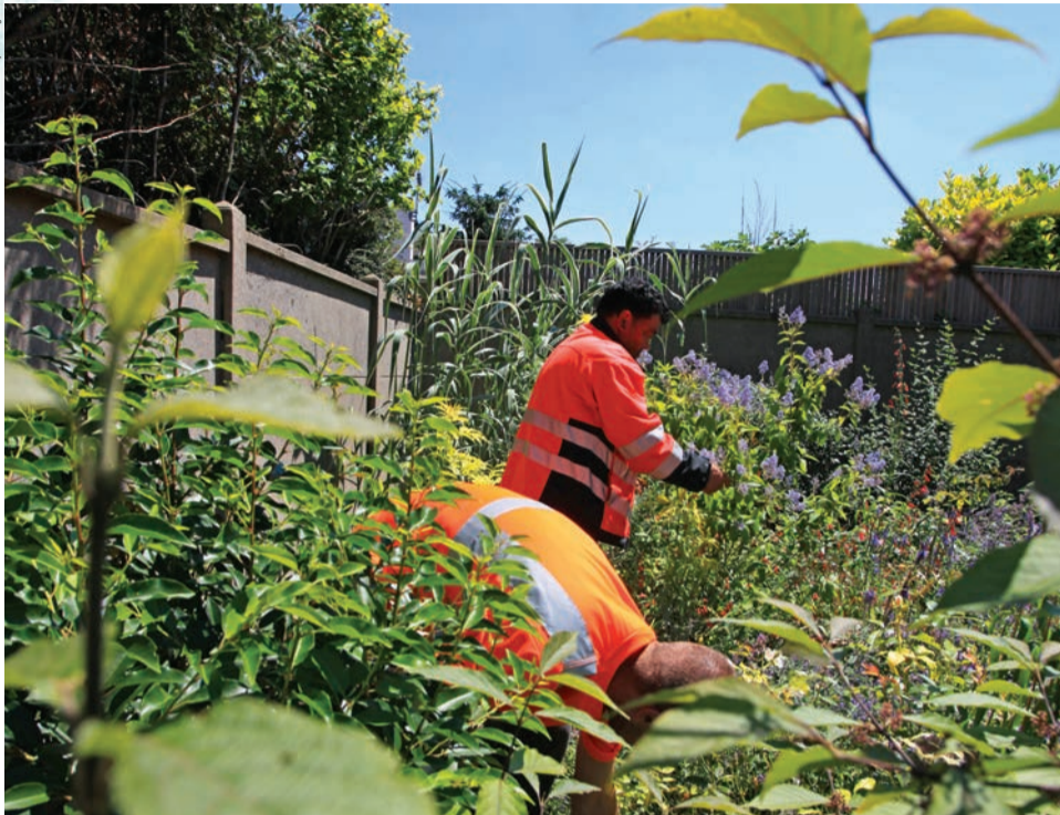
La Ville de Houilles n'utilise plus de produits phytosanitaires. Ci-dessus : désherbage manuel par des jardiniers municipaux.

À compter du 1 er janvier 2017, l'usage de produits phytosanitaires (insecticides, herbicides) sera interdit sur l'ensemble des espaces verts, promenades, forêts et voiries gérés par l'État et les collectivités locales. La Ville de Houilles, de son côté, a supprimé, depuis 2009, leur utilisation ainsi que celle des engrais chimiques dans les espaces verts et les serres municipales, en les remplaçant par des méthodes respectueuses de l'environnement : désherbage manuel et mécanique, paillage des massifs, fauchage bisannuel des espaces en friche, lutte biologique et usage d'engrais biologiques.