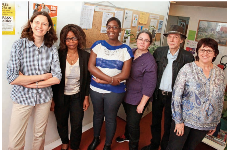
L'équipe de l'association Ami services 78.