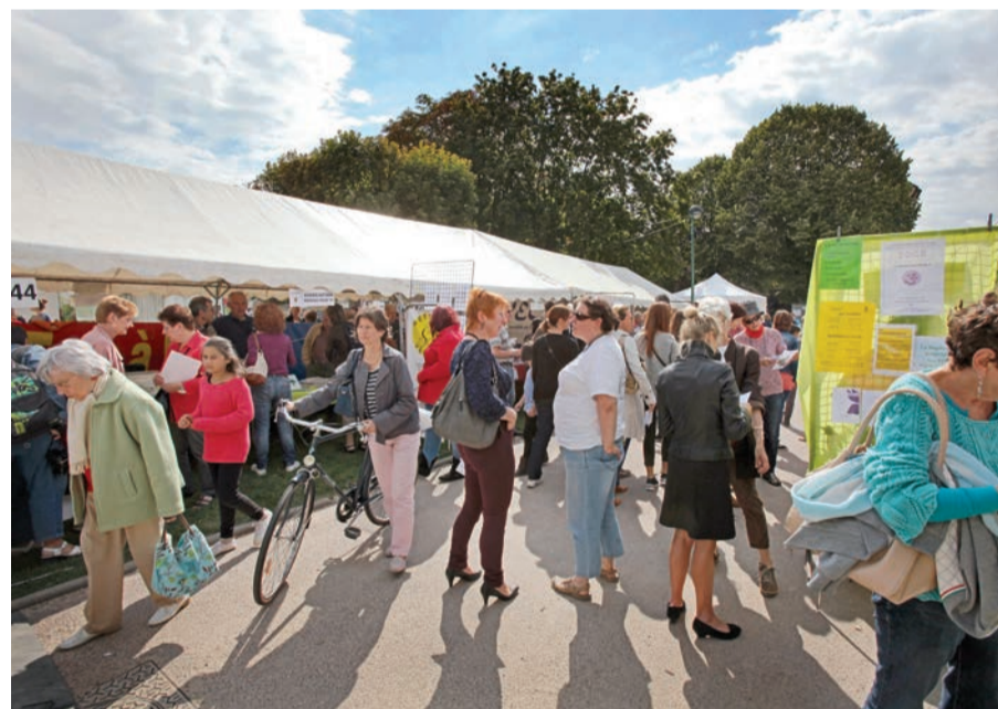
Forum des associations, parc Charles-de-Gaulle.

Le 3 septembre, les associations se donnent rendez-vous dans le parc Charles-de-Gaulle pour la 19 e édition de leur forum. Une rencontre organisée par l'Union oilloise d'associations (Unova). L'occasion de découvrir un large éventail d'activités proposées par plus de 80 associations réunies sur un même lieu durant une journée. Conviviale et de plus en plus fréquentée, cette manifestation est une véritable vitrine qui permet aux associations de se faire connaître, de promouvoir leurs activités, de rencontrer des bénévoles et d'encourager de nouvelles adhésions. Pour de nombreux Oillois, ce sera l'occasion de trouver une activité sportive,