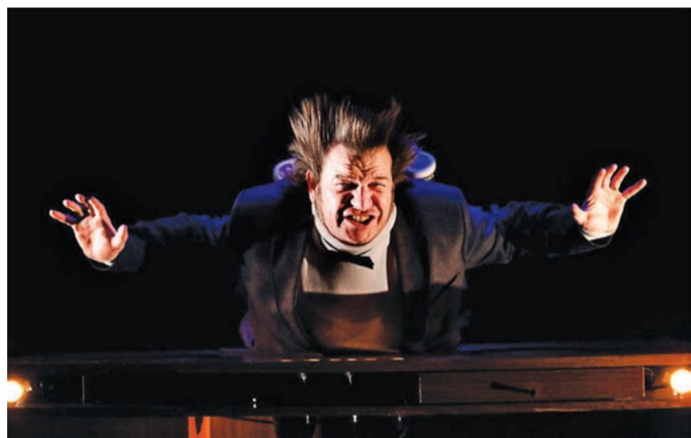
« Fin de série », par la C ie Bob Théâtre.

Émotion, divertissements, surprises, la rentrée culturelle oilloise offre des spectacles qui se déclinent sur tous les tons. À l'affiche : « Trois Petits Cochons » et « Fin de série ». L'occasion pour petits et grands de partager des moments divertissants et plein d'humour.