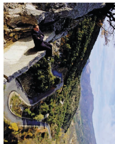
Photographie de Philippe Ramette.