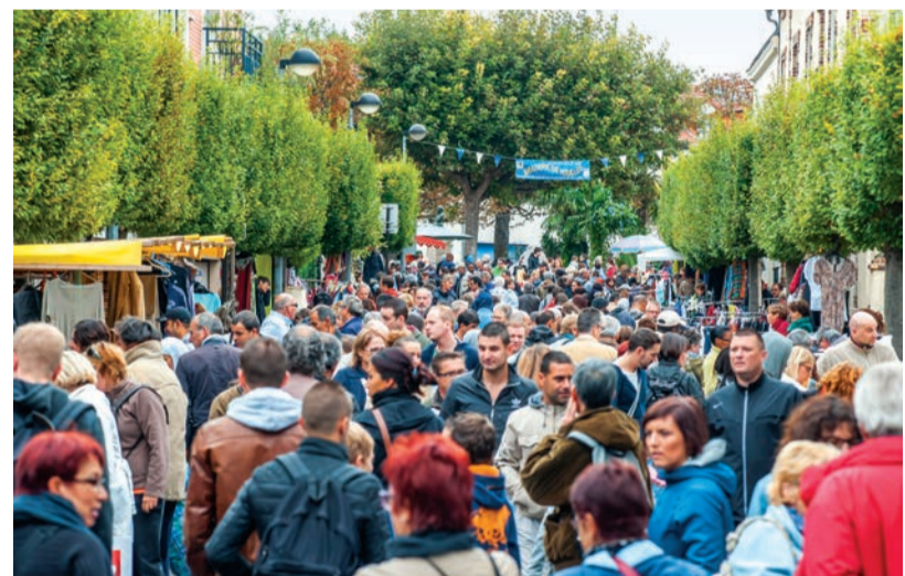
Braderie de Houilles, édition 2015.

La braderie de Houilles, considérée comme la deuxième du genre après celle de Lille, n'aura pas lieu cette année. À la suite des attentats survenus en France, l'Association des commerçants et artisans de Houilles (Acah) et la municipalité, organisatrices de la manifestation, ont décidé d'annuler la 44 e édition, qui devait se tenir le dimanche 2 octobre. Une décision qui s'inscrit dans le cadre de l'état d'urgence, prolongé jusqu'au 1 er janvier 2017, et du plan Vigipirate « niveau alerte attentats », exigeant que les consignes de vigilance et